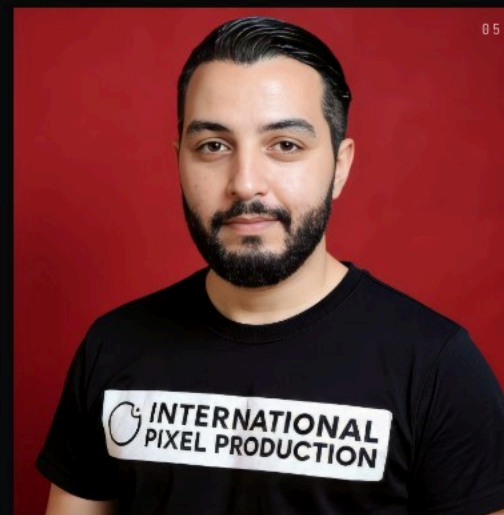
MARWEN CHRIGHUI CRÉATIF