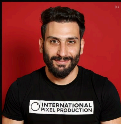
AHMED JOUINI PRODUCTION